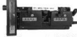
Belmogtwin MK II BELMOG