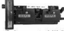
Belmogtwin MK II BELMOG